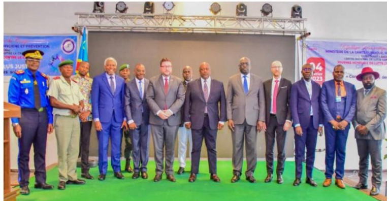
Photo de famille lors de célébration de la 23 ème journée du cancer à Kinshasa